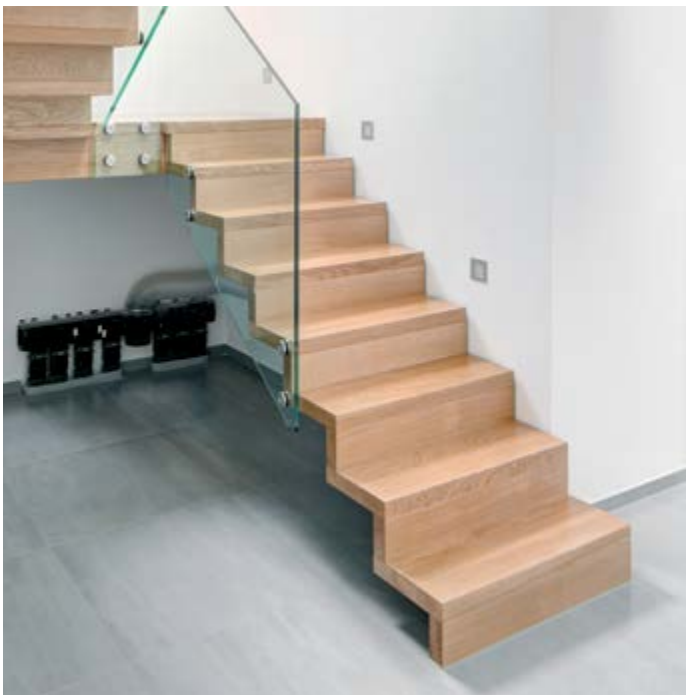
FALTWERK Treppe aus Eiche mit lackierter Oberfläche gefertigt. Das verglaste Geländer wird über Pukthalter aus Edelstahl fixiert. FA049