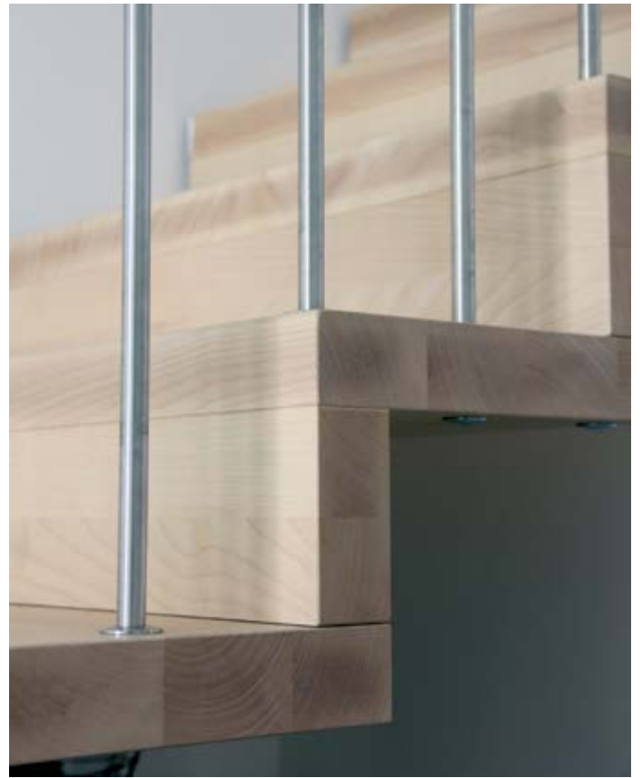
FALTWERK aus europäischen Ahorn gefertigt. Ausführung mit Edelstahlstäben. Oberfläche dreifach lackiert.