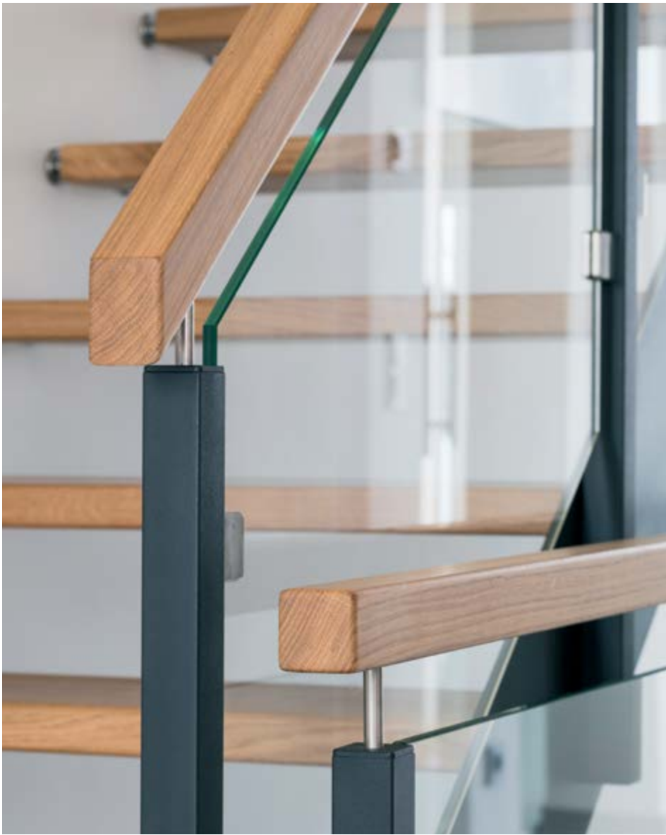
STEELLINE Treppe als wandgebolzte schalldämmende Ausführung, Stufen aus Holzart Eiche MB gefertigt, Oberfläche umweltfreundlich geölt, Pfosten als Quadratpfosten, Geländerfüllung aus Sicherheitsglas.